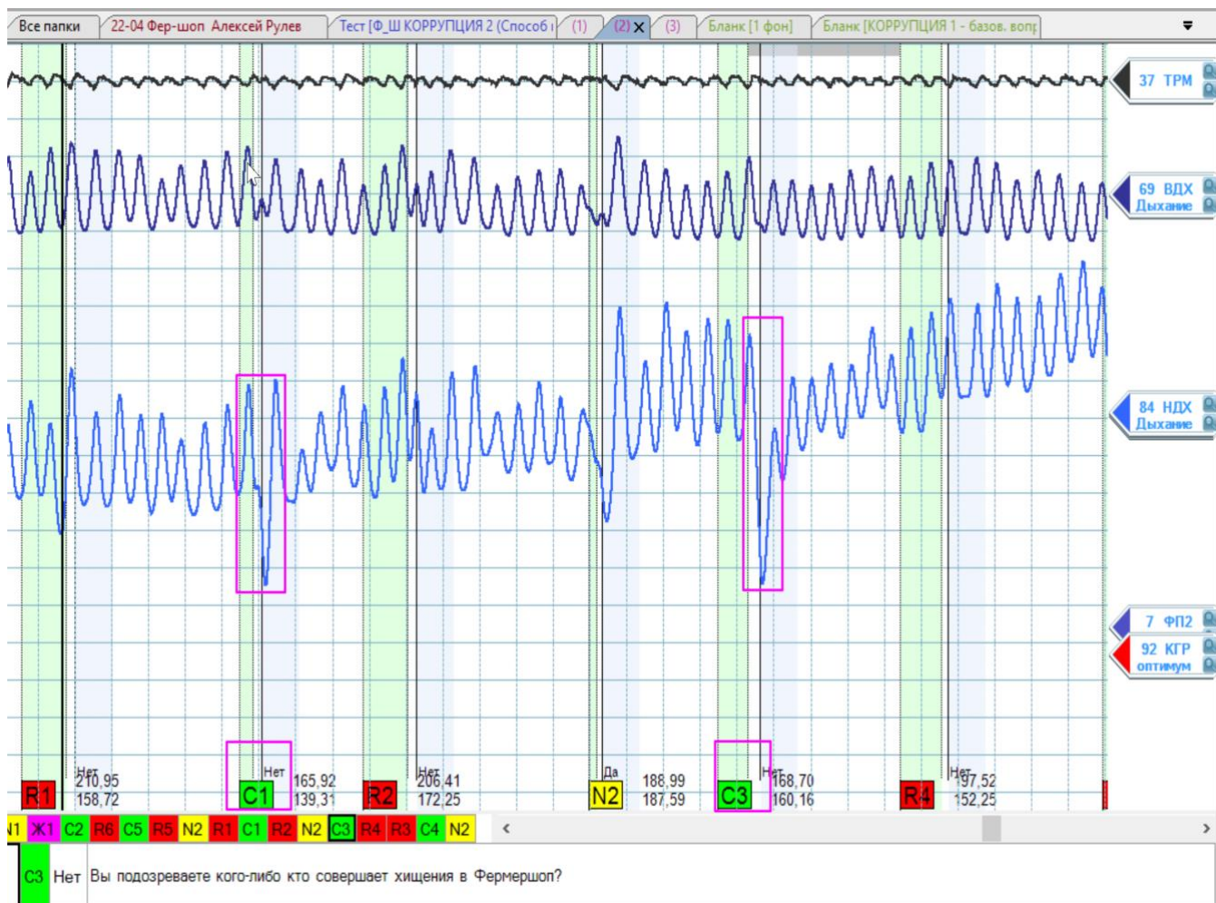
Рис. Полиграмма с признаками противодействия. Усиленный выдох (в 2-3 раза сильнее обычного выдоха) на служебные вопросы (зеленый маркер вопросов) для усиления контрольных вопросов сравнения с целью повлиять на результат теста.